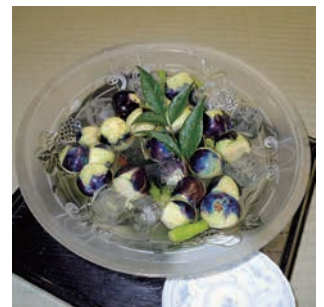
金田幹事作「なす漬け」