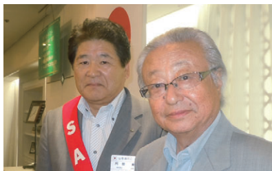
マルチプルボールハリスフェロー表彰 (2回目)