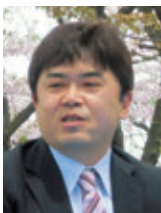
太田親睦活動委員長あいさつ

皆さん、こんにちは。外でやるということで心配でした天気ですが、このように晴れました。桜の下でおいしい食事とたのしい時間を皆さんと過ごしたいと思いますので宜しくお願いいたします。