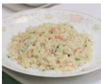
サーモンの広東式焼き物 温野菜添え