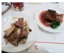
牛肉と山芋の オイスターソース炒め 揚げ豆腐と豚角煮 蝦醬煮込み