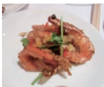
殻付き海老の ガーリックソース炒め