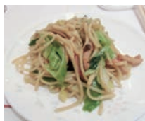
麻辣醬の焼きそば