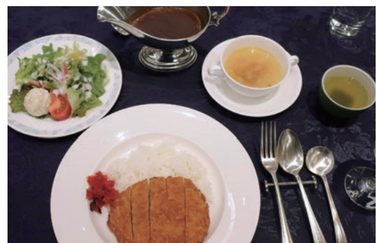
チキンカツカレー、サラダ、スープ