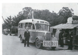
昭和26年 山交バスで広報宣伝。背景の社は薬師公園馬見ヶ崎橋附近で