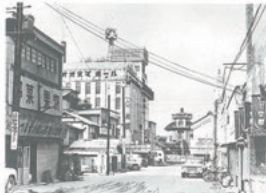
昭和30年10月 交通安全 山形女性運転者会の安全呼びかけ（七日町通り）