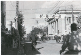
昭和10年の市内七丁目十字路。市内でも最も交通のり繁華とてあつた。当時の警察官の手配により交通整理が行われていた。