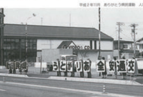
昭和30年11月 乗りかたの交通安全 人間教育館前