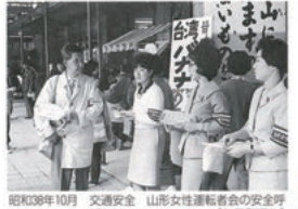
昭和30年10月 交通安全 山形女性運転者会の安全呼びかけ（七日町通り）