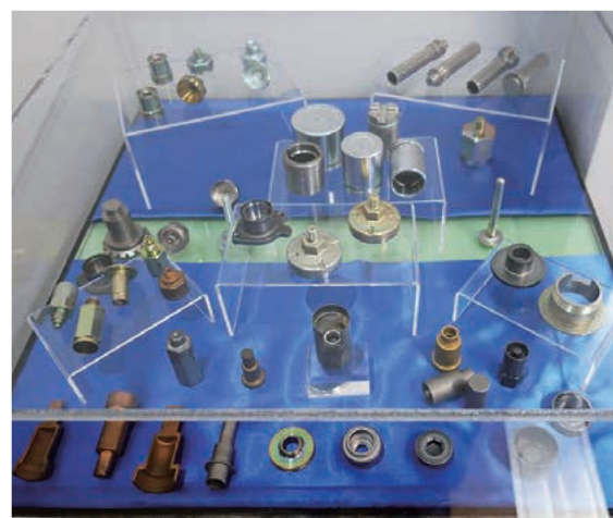
製造している部品