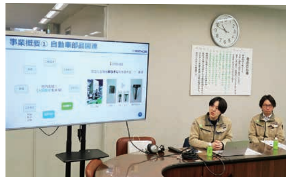
総務課の方から会社概要等の説明